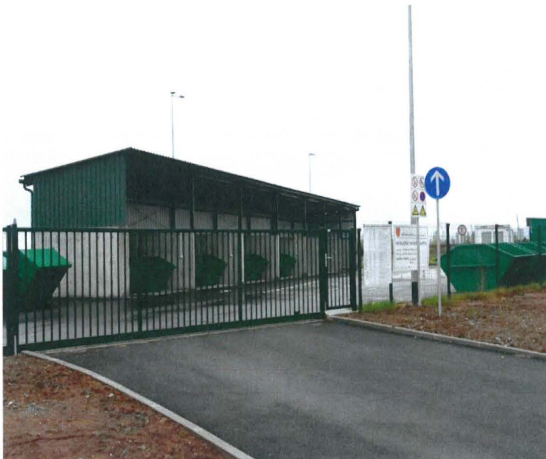
Slika 1. Reciklažno dvorište za područje Općine Kaptol

U skladu s zakonskom obvezom, od travnja 2022. godine počelo je s radom reciklažno dvorište Općine Kaptol koje je smješteno u Novim Bešincima, uz prometnicu Kaptol - Kutjevo.