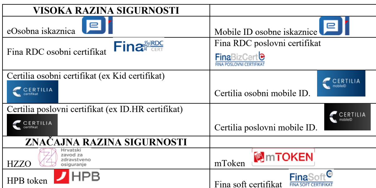
Tablica 2. Prikaz razine sigurnosti

Prethodna tablica prikazuje katalog usluga koje su dostupne na sustavu e-Građani. Usluge su grupirane kroz teme iz raznih područja života građana.