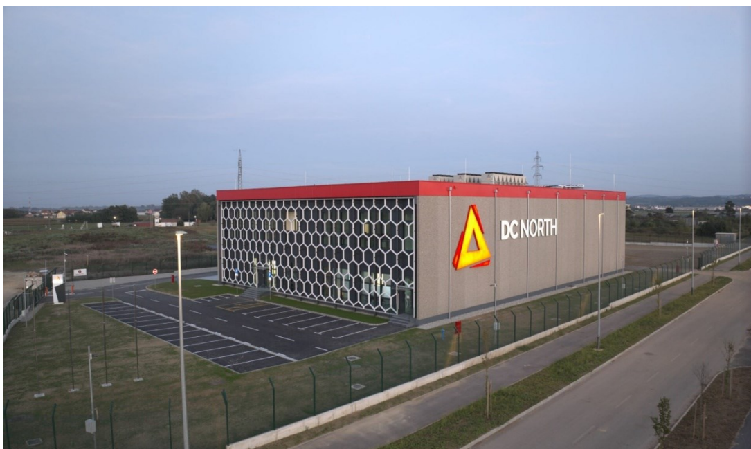
Slika 2. Data Centar North, Varaždin

Slika prikazuje najsuvremeniji podatkovni centar u ovom dijelu Europe koji je opremljen najboljom i najmodernijom opremom na tržištu.