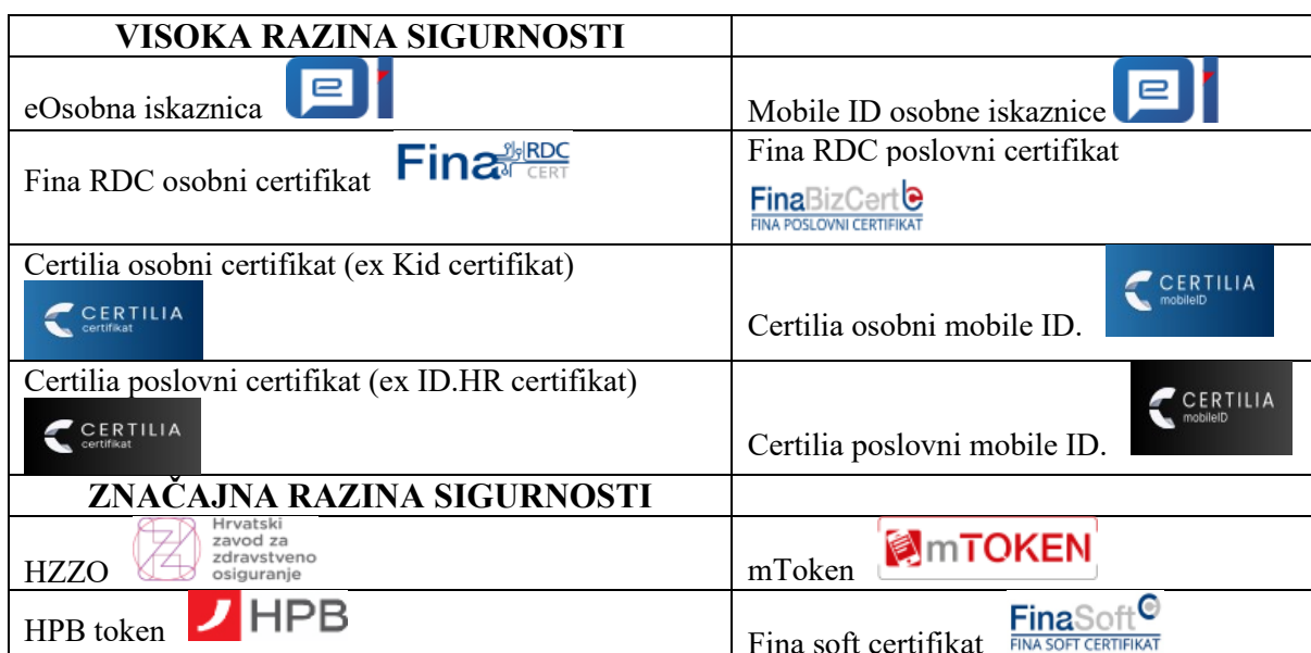
Tablica 2. Prikaz razine sigurnosti

Prethodna tablica prikazuje katalog usluga koje su dostupne na sustavu e-Građani. Usluge su grupirane kroz teme iz raznih područja života građana.