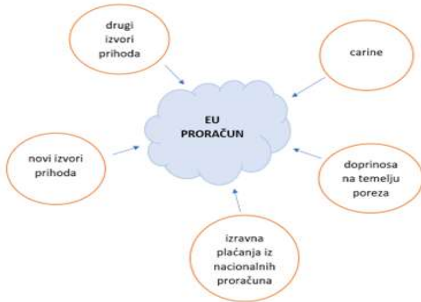
Slika 6. Proračun Europske unije