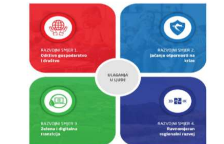
Slika 9. Razvojni smjerovi Nacionalne razvojne strategije RH do 2030. godine