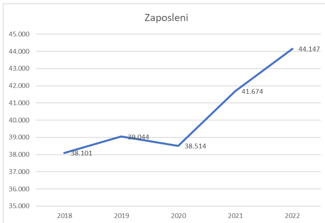
Grafikon 3. Broj zaposlenih u djelatnostima zaštite okoliša od 2018. – 2022.