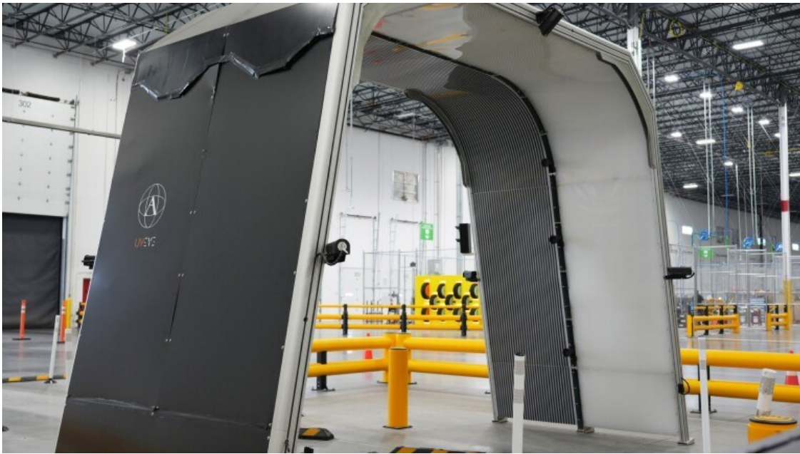
Slika 2. Prolaz za automatizirani pregled vozila