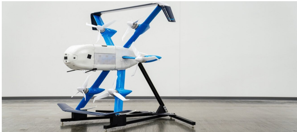
Slika 5. Prime Air dron