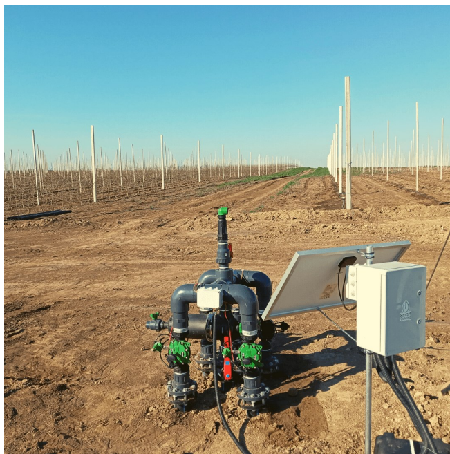
Slika 9. Sustav za pametno navodnjavanje Smart Watering

Aplikacija šalje notifikacije u realnom vremenu o stanju opreme na terenu, uključujući informacije o pucanju cijevi, zagušenjima i niskoj vlažnosti. Digitalizacija navodnjavanja omogućuje upravljanje prema informacijama sa polja, pružajući podesivost i osiguravajući konstantno optimalnu vlažnost tla. (Digital agro, url)