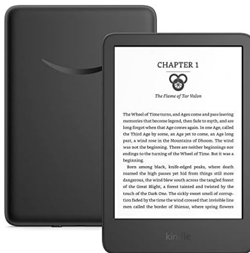
Slika 6. Kindle – bežični elektronički čitač