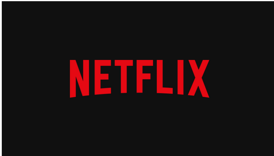
Slika 7. Netflix - logo