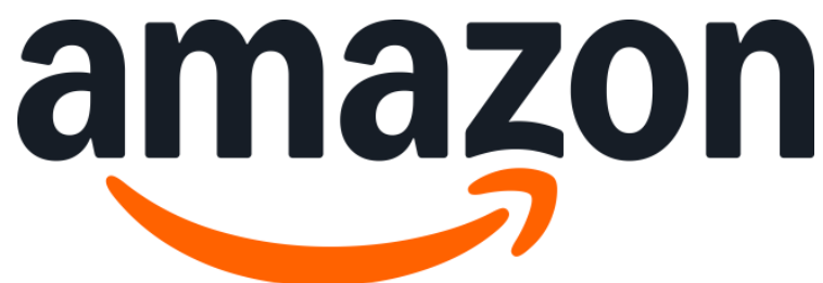
Slika 1. Amazon - logo

Dana 5. srpnja 1994. godine, Jeff Bezos, diplomirani student s Princetona i poduzetnik, pokreće Cadabra - naziv inspiriran riječju “Abracadabra” - koja je u početku bila samo online knjižara vođena iz njegove garaže u Bellevue, Washington. Kasnije je naziv promijenjen u Amazon, a tvrtka je brzo narasla u globalnog maloprodajnog lidera i postala poznata kao online “trgovina sa svime”, ostvarujući stotine milijuna dolara godišnje.