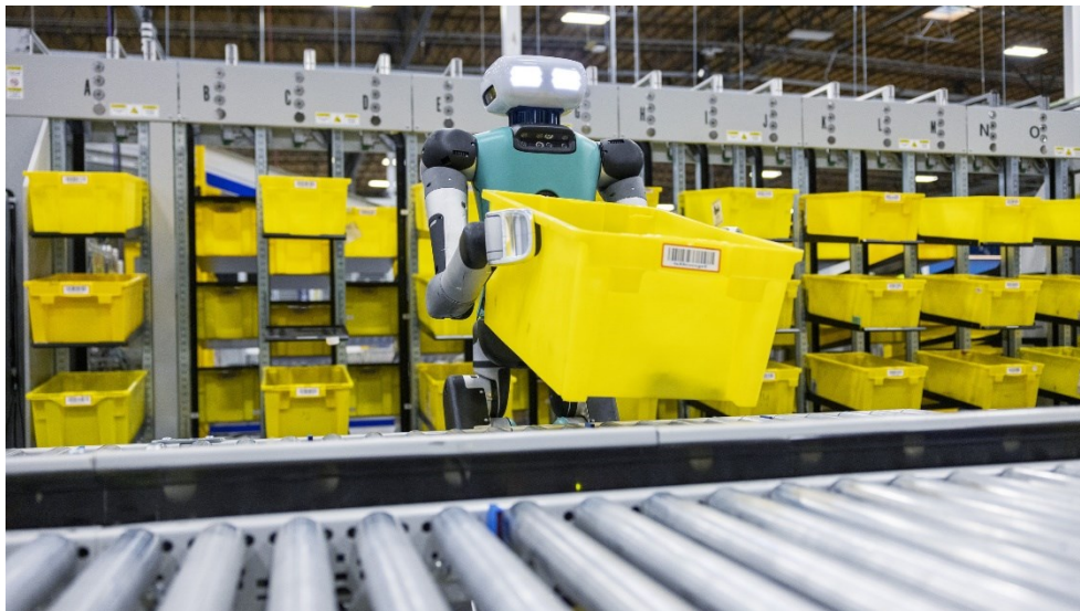
Slika 4. Digit robot

Prema riječima zaposlenika Amazona, Digit je robot koji se može kretati, hvatati i rukovati predmetima u prostorima i kutovima skladišta na nove načine. Digit je dovoljno snažan da podiže i slaže kutije teške do 18 kilograma. Njegova veličina i oblik su dobro prilagođeni zgradama dizajniranim za ljude, a postoji velika prilika za širenje mobilnog manipulatora poput Digita, koji može surađivati sa zaposlenicima. Početno korištenje ove tehnologije bit će usmjereno na pomoć zaposlenicima u reciklaži kutija, što je repetitivan proces podizanja i premještanja praznih kutija nakon što su zalihe potpuno uklonjene iz njih. (Robots, url)