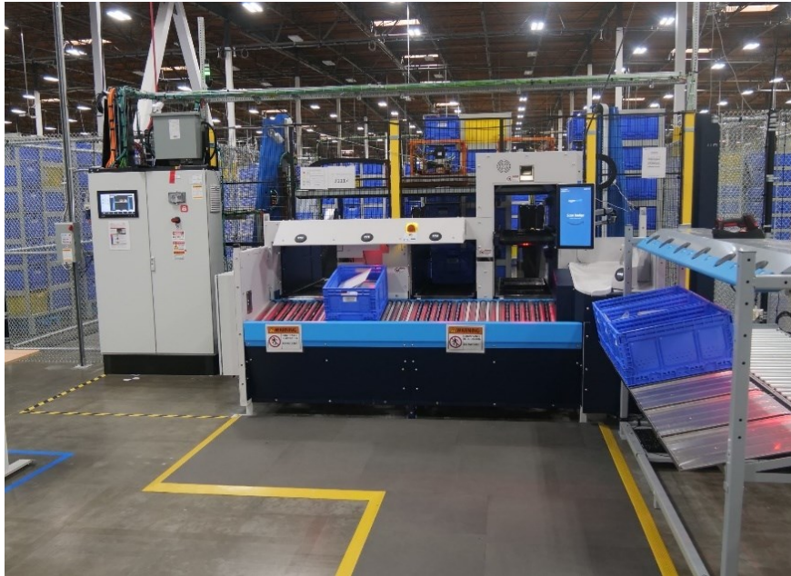
Slika 3. Sequoia robotski sistem

Sequoia je sustav za skladištenje u kontejnerima koji prilagođava poziciju kutija zaposlenicima, tako da se nalaze u ergonomskim zonama, između sredine bedara i sredine prsa. Kutije su postavljene pod kutom koji olakšava uzimanje predmeta. (Bishop, 2023, url)