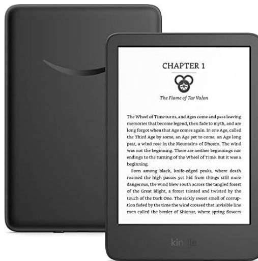
Slika 6. Kindle – bežični elektronički čitač