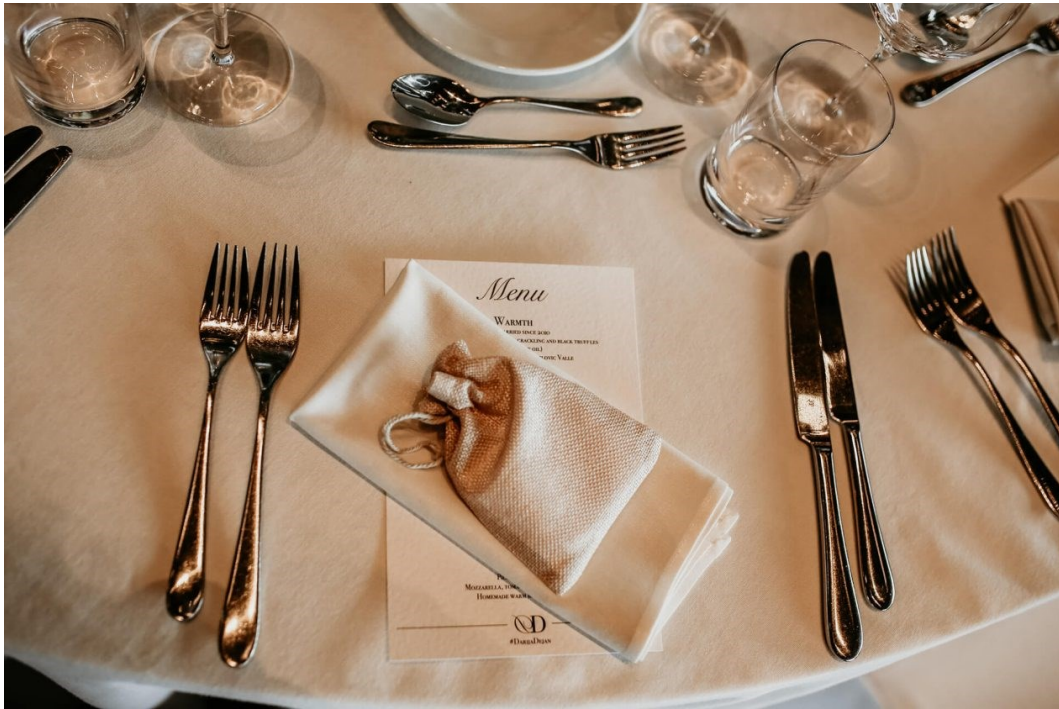
Slika 5. Primjer svečanog postava

Kartica s imenom gosta postavlja se iznad tanjura, povrh desertnog pribora, u nekim slučajevima se postavlja i na sam tanjur, tj. na ubrus. Kartica s imenom gosta je obvezna na svim svečanim obrocima, ona pokazuje i znak poštovanja prema gostu koji dolazi na večeru. Obično je to deblji bijeli papir dimenzije 10 x 7 centimetara, kartice se ispisuju lijepim rukopisom jer toplinu rukopisa ne može zamijeniti print. Kartica s imenom značajno olakšava smještaj gostiju na njihova mjesta pri dolasku. Slika 6. prikazuje primjer kartice s imenom gosta.