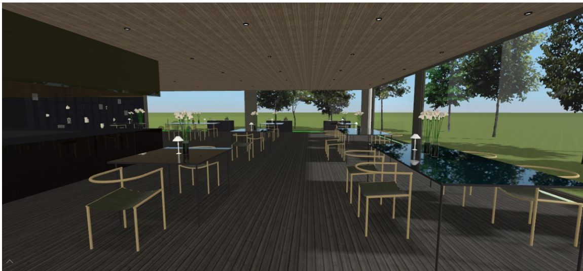
Slika 9. Raspored stolova u restoranu