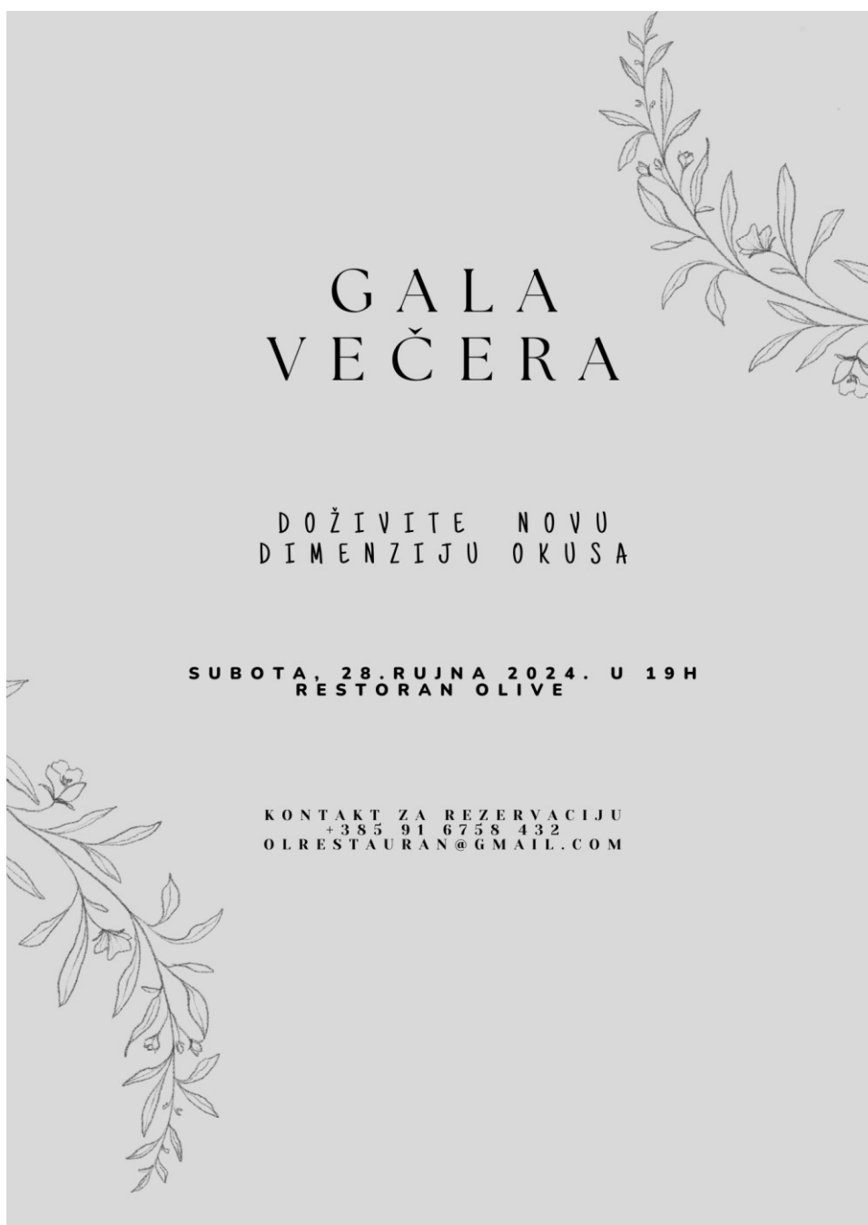
Slika 7. Pozivnica za Gala večeru