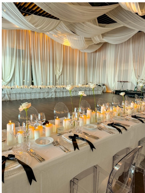
Slika 3. Primjer postavljanja stola u obliku slova u I