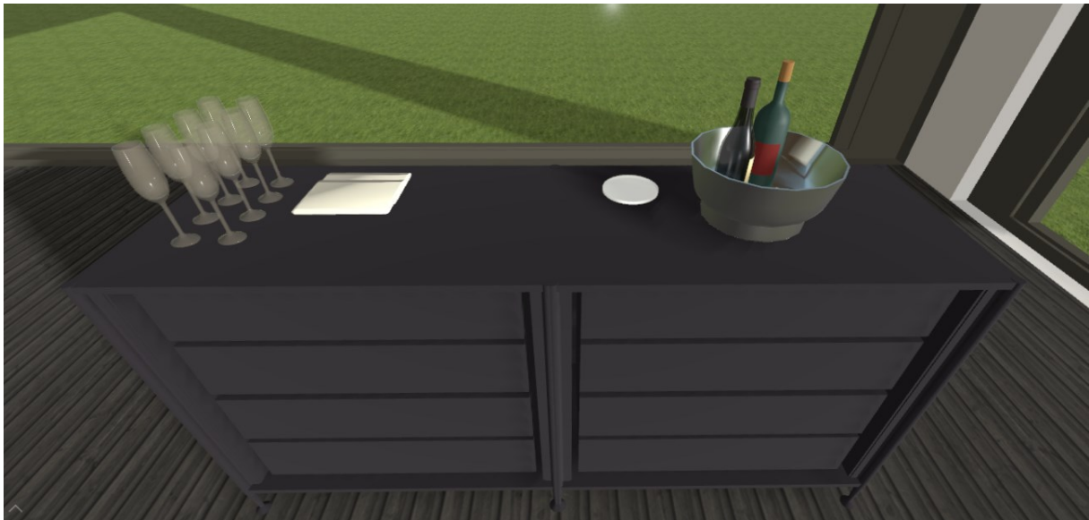
Slika 11. Izgled konobarskog radnog stola

S obzirom na samu ideju gala večere i način posluživanja, konobarski radni stolovi moraju biti dobro pripremljeni. Kako je osmišljeno nakon svakog slijeda gostu zamijeniti postav, tj. postaviti novi pribor za jelo, novu čašu za vino, vrlo je važno konobarski radni stol opremiti sa svim potrebnim inventarom kako bi tijekom večeri išao po planu. Buduće da je za svaki stol potrebno poprilično puno inventara i čaša, ideja je postaviti male radne stolove u blizini svakog stola. Izgled konobarskog radnog stola prikazan je na slici 11. Na konobarskom radnom stolu mora biti spremno pribor za svaki slijed, plus dodatno nekoliko u rezervi ukoliko gostu pribor ispadne i slično. Konobari si mogu pripremiti i vina u vedricama za posluživanje netom prije posluživanja gosta, isto tako imati sve potrebno za otvaranje vina na radnom stolu (vadičep, ubrus, svijeća, dekanter, čaše za provjeru kakvoće vina, mali tanjurić za odlaganje plutenog čepa i sl.).