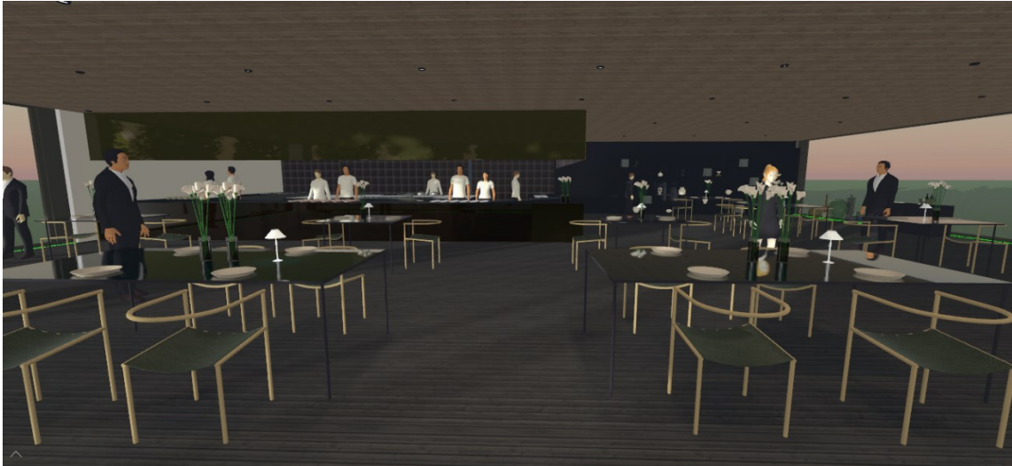
Slika 8. Pogled na otvorenu kuhinju