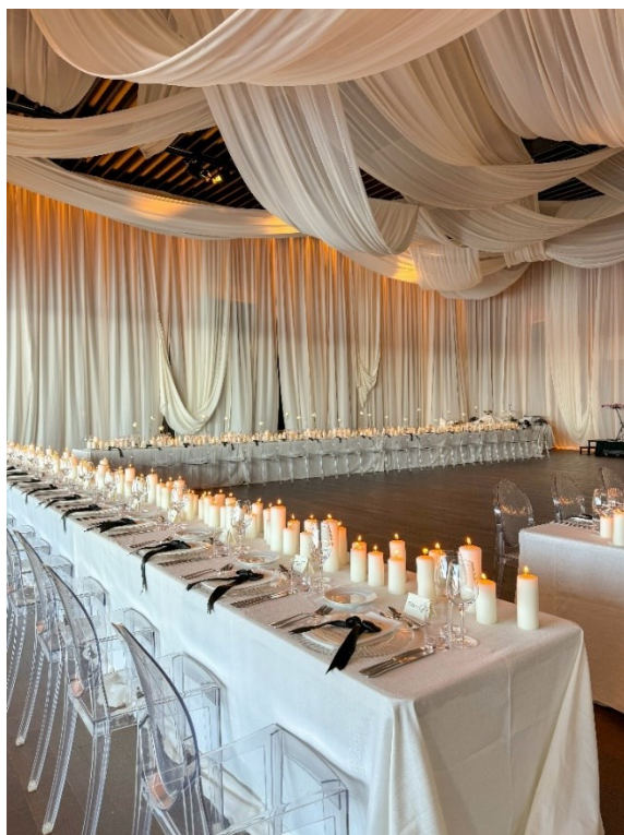
Slika 2. Primjer postavljanja stola u obliku slova U