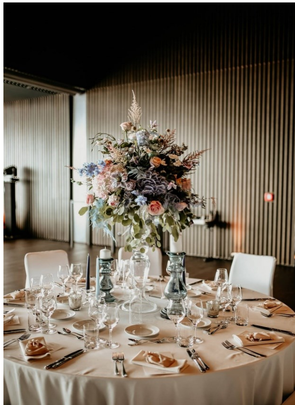
Slika 4. Cvjetni aranžman na stolu