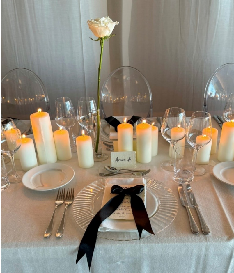
Slika 6. Kartica s imenom gosta