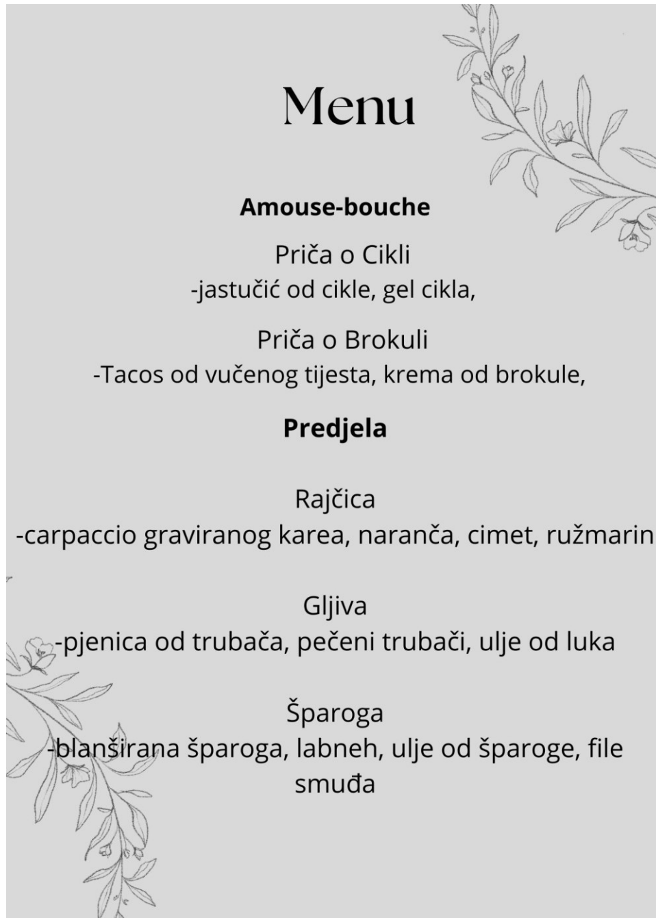
Slika 12. Meni za Gala večeru (str. 1)

Meni za gala večeru je osmišljen u obliku 10 sljedova (slika 12 i 13) tako da svaki gost dobiva identično jelo tj. gost nema drugi izbor hrane, a jela su napravljena od sezonskih namirnica.