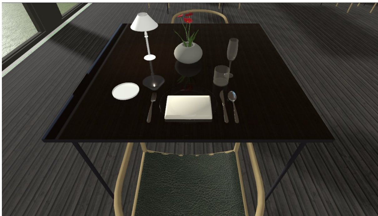
Slika 10. Postav stola

Nakon pripreme stolova slijedi postav, kao i do sada niti postav neće biti onaj klasični, u pravilu na stol se postavlja prvo ukrasni tanjur, i pribor za jelo za prva četiri slijeda, no ovaj postav biti će malo drugačiji, kako je naglasak na hrani, želi se stvoriti pravi doživljaj tako da se stvori atmosfera da stol bude poput umjetničkog platna dok hrana koja je poslužena bude pravo umjetničko djelo. Na stol se prvo postavlja ubrus, jednostavno složen na koji se postavlja pismo na kojemu se nalazi cijeli meni. Pribor za jelo postavlja se samo za prvi slijed. S lijeve strane postava stavlja se tanjurić za kruh i nož za maslac. Čaša za vodu postavlja se iznad vrha noža, te desno od čaše za vodu postavlja se čaša za vino koje je posluženo za prvi slijed. Ostali pribor za jelo pripremljen je na konobarskom radnom stolu, kako se mijenja slijed tako konobari pripremaju novi postav, isto tako za čaše, prije novog slijeda uz koje ide novo vino, mijenja se čaša za vino. Iznimka je ako gost ne želi prelaziti na nova vina, već mu se vino koje je trenutno u čaši sviđa, tome gostu nije potrebno zamijeniti čašu, već samo nastaviti točiti isto vino. Na sredini stola postavlja se ambijentalna rasvjeta koja će osvijetliti stol, i mali jednostavni cvjetni aranžman kako bi stol ostao jednostavan i čist. Slika 10 prikazuje postav stola za gala večeru. Mali stolni inventar pripremljen je na konobarskom radnom stolu kako bi bio na dohvat ruke konobarima ukoliko gosti zatraže.