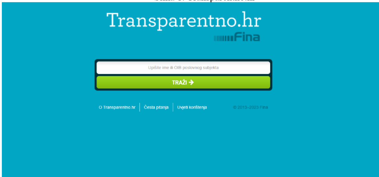
Slika 1. Transparentno.hr

Transparentno.hr je jedna vrsta servisa koji omogućuje i daje na uvid svakoj fizičkoj osobi u podatke o poslovanju obveznika poreza i slično. Građani na taj način mogu vidjeti na koji način i za koje potrebe općine/grada se troše javna sredstva. Upisujući nazive Općine ili Grada koji nas zanima, lako je doći do podataka koji smiju biti javno dostupni. Na taj način vladajući pokušavaju opravdati rad uprave te ujedno zadobiti povjerenje građana.