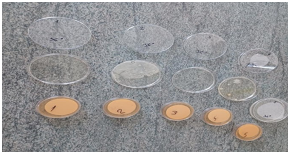
Slika 7. Rezultati određivanja ukupnog broja kolonija na 36 °C

maksimalno dopuštenim koncentracijama. Ukupni broj kolonija na 22 °C (osim uzoraka broj 2 i 5) te ukupni broj kolonija na 36 °C (osim uzoraka broj 2,3,5) također ne odgovaraju maksimalno dopuštenim koncentracijama. Iz tablice se vidi da niti jedan uzorak mikrobiološki ne odgovara.