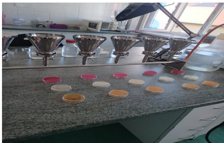
Slika 4. Membranska filtracija

Uređaj koji se koristi za membransku filtraciju prije same upotrebe potrebno je dezinficirati uz pomoć vate koju je potrebno prije toga umočiti u 70 % - tni alkohol te se nakon toga sterilizira plamenom iz plamenika. Lijevak je potrebno ukloniti. Pincetu je potrebno sterilizirati plamenom iz plamenika te se s njom prihvati filter papir i mrežastim dijelom koji je okrenut prema dolje postavi se na sredinu držača filtera. Na uređaj se vrati lijevak te se učvrsti držačem. U svaki lijevak je potrebno uliti 100 ml vode što ovisi o tome koliko se uzoraka vode ispituje. Nakon toga se uključi vakuum pumpa i lijevak se ukloni. Membranski filter se sterilnom pincetom prenese na hranjivu podlogu u Petrijevu zdjelicu te se pazi da ne ostanu mjehurići zraka. U slučaju da ostanu membranu treba podići s hranjive podloge i ponovno ju vratiti na hranjivu podlogu. Nakon toga procesa uzorci idu na inkubaciju, a sama temperatura i vrijeme ovise o vrsti bakterija čija se prisutnost ispituje (Arhiva Zavoda za javno zdravstvo Požeško – slavonske županije).