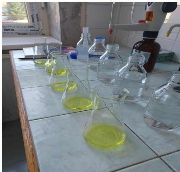
Slika 6. Određivanje klorida