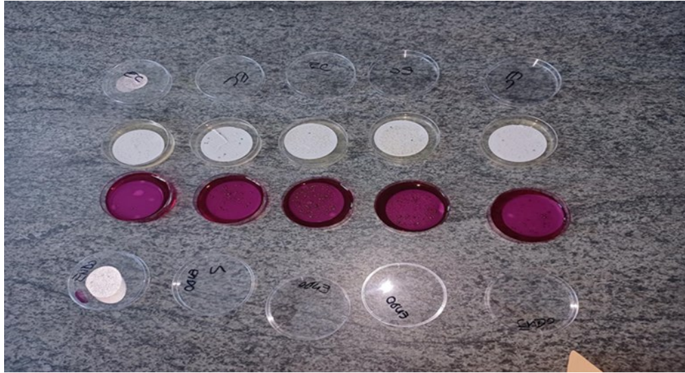
Slika 9. Rezultati određivanja Escherichia coli