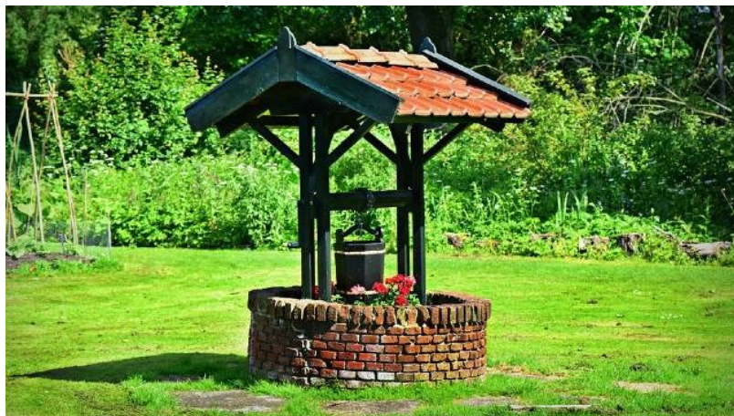
Slika 3. Bunar (Gospodarski list, url)

Bunar je iskop u vodi namijenjen za hvatanje ili prikupljanje podzemne vode. Kod tradicionalnih bunara unutrašnjost je ograđena zidovima od opeke ili kamena, dok su moderni bunari sigurno učvršćeni. Nadzemna konstrukcija izgrađena je u skladu s lokalnim običajima, a voda se crpi pomoću metalne posude koja je obješena na mehanizam vitla. Bunar je konstrukcija namijenjena korištenju vode ispod zemlje. U nekim slučajevima služi i za razinu regulacije otpadnih voda. Bunari se mogu stvoriti iskopavanjem, bušenjem ili razbijanjem. Značajke bunara variraju ovisno o prirodi toka vode, bilo s otvorenom površinom ili pod pritiskom poznati kao arteški bunari gdje se voda pod pritiskom prirodno diže na površinu (Gospodarski list, url).