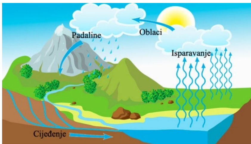
Slika 1. Kruženje vode u prirodi (Voda izvor života, url)

Vodeni resursi na Zemlji obnavljaju se kontinuiranim kruženjem vode. Kako voda cirkulira u prirodi, njezin se sastav mijenja. Prolazi površinskim i podzemnim tokovima, a teče preko raznih industrijskih, urbanih, prometnih i poljoprivrednih površina te čisti atmosferu. Kroz ovaj proces voda prolazi kroz transformacije, mijenjajući svoja svojstva unutar cijelog hidrološkog sustava (Tušar, 2009).