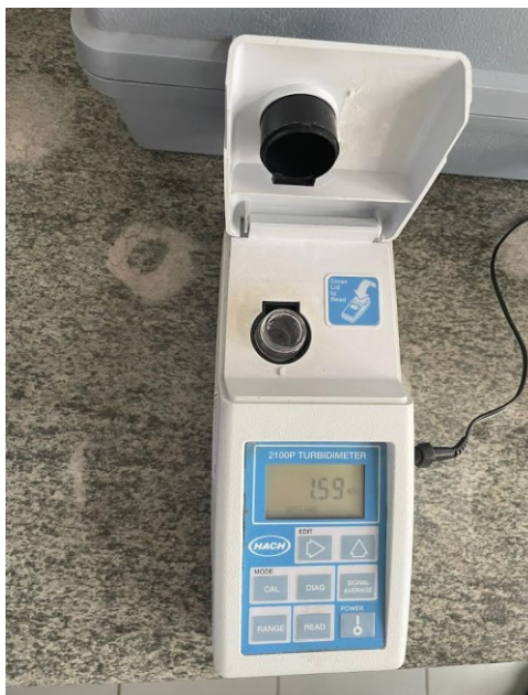
Slika 5. Turbidimetar (Izvor: autor)