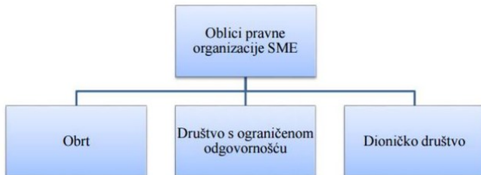
Slika 1. Najčešći oblici pravne organizacije malih i srednjih poduzeća