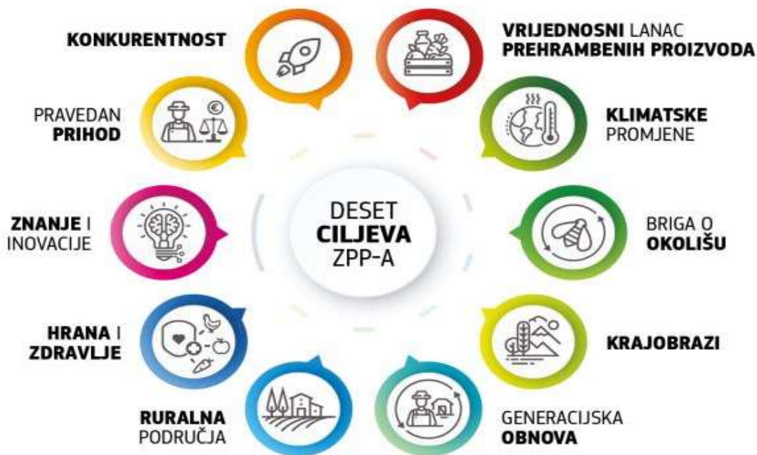
Slika 3. Ključni ciljevi politike ZPP-a