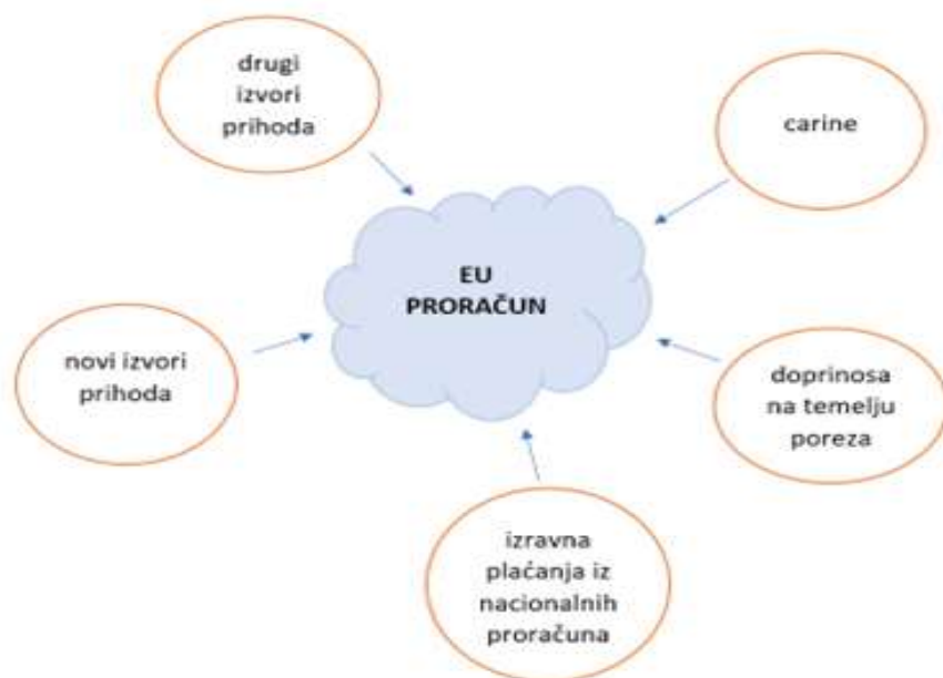
Slika 6. Proračun Europske unije