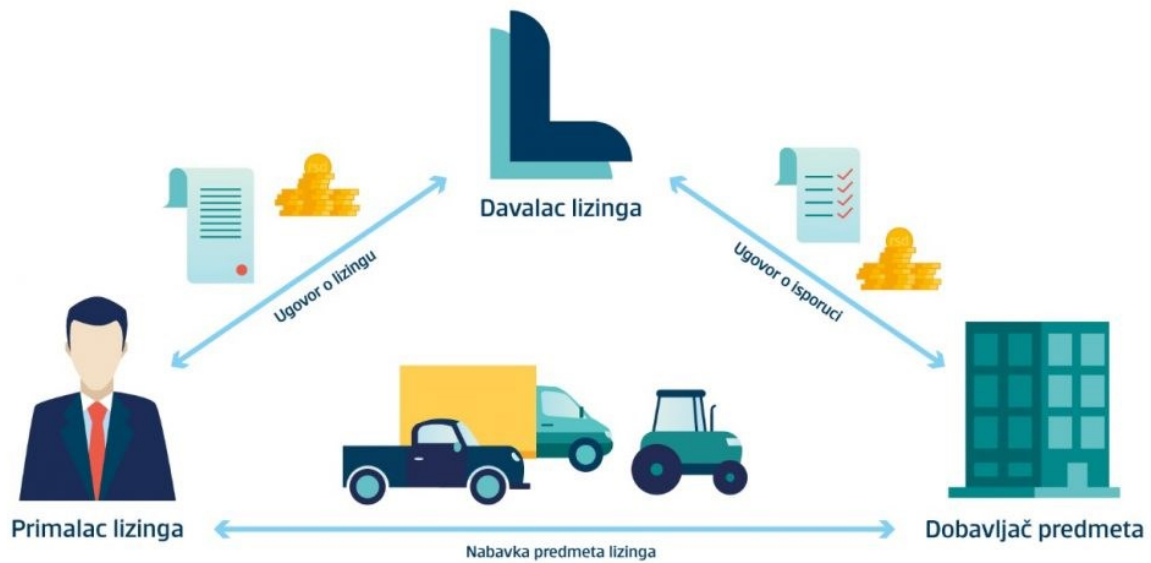
Slika 2. Leasing