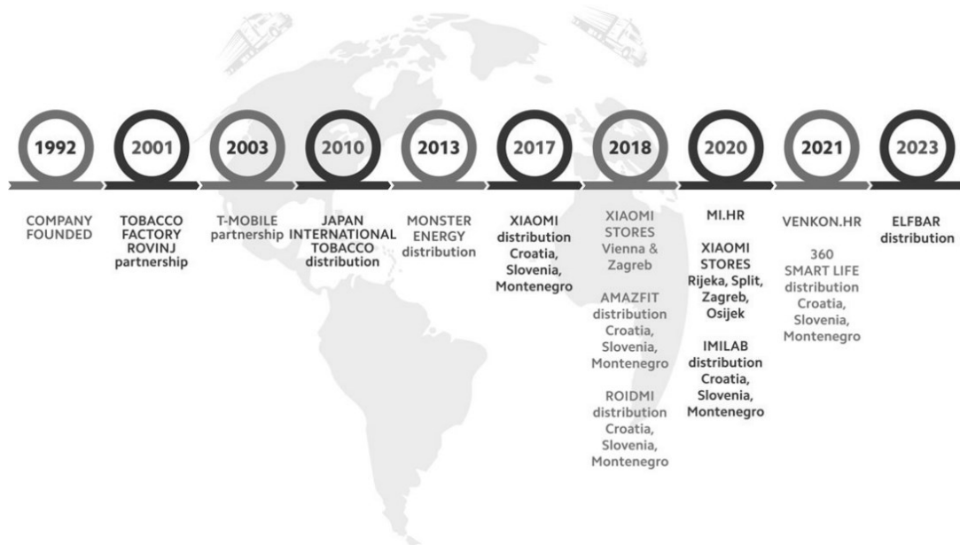
Slika 5. Od male obiteljske tvrtke do prepoznate distribucijske kompanije