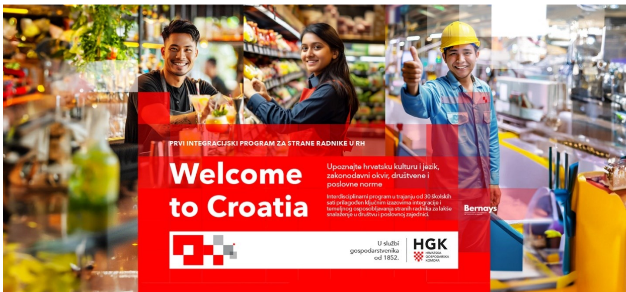
Slika 11. Wellcome to Croatia