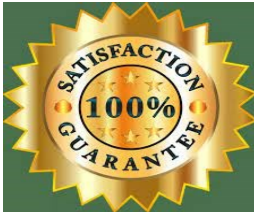
Slika 4. Garancija zadovoljstva