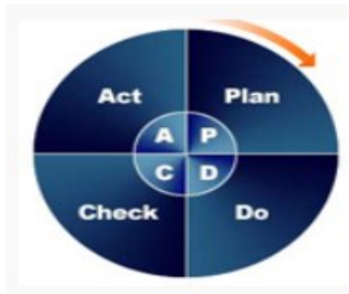
Slika 2. PDCA krug (Demingov krug)