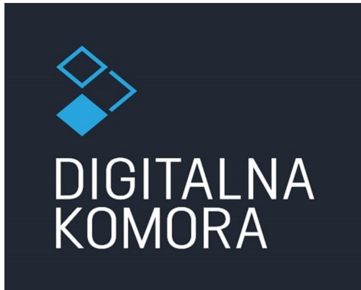
Slika 7. Digitalna komora