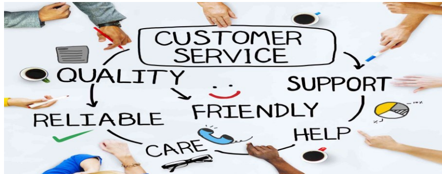
Slika 3. Zadovoljstvo kupaca

Izvor: Poslovni-savjetnik.com (2016) URL: https://www.poslovni-savjetnik.com/tagovi/zadovoljstvo-kupaca (Pristup 2024-3-28)