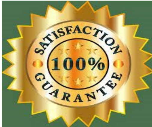
Slika 4. Garancija zadovoljstva