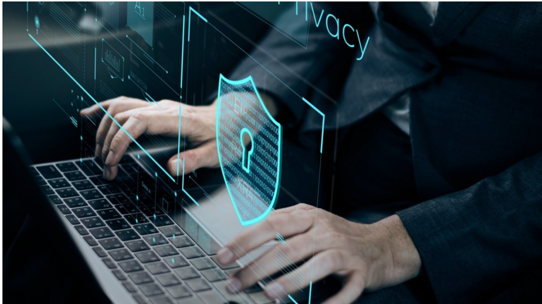
Slika 6. Zaštita osobnih podataka

Izvor: Feralis.hr (2022) Zaštita osobnih podataka i privatnost. URL: https://feralis.hr/en/centar/gdpr-teme/zastita-osobnih-podataka-i-privatnost (Pristupljeno 2024-3-28)