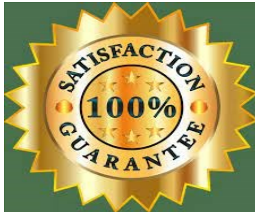
Slika 4. Garancija zadovoljstva