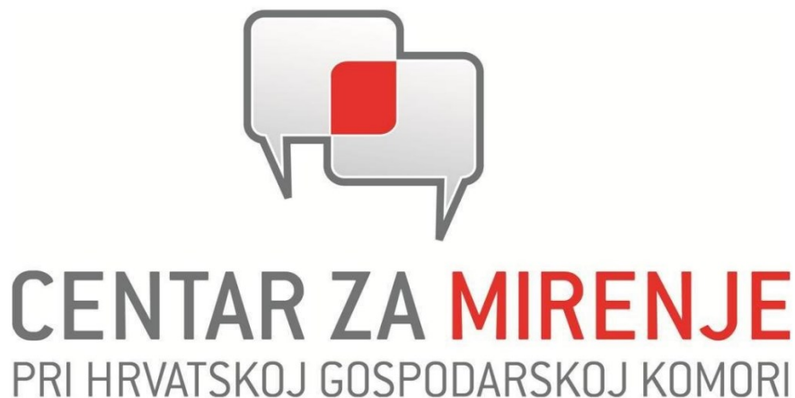
Slika 10. Logo centra za mirenje