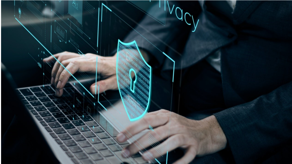
Slika 6. Zaštita osobnih podataka

Izvor: Feralis.hr (2022) Zaštita osobnih podataka i privatnost. URL: https://feralis.hr/en/centar/gdpr-teme/zastita-osobnih-podataka-i-privatnost (Pristupljeno 2024-3-28)