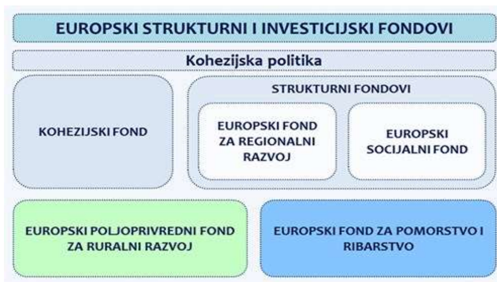
Slika 8. Europski strukturni i investicijski fondovi