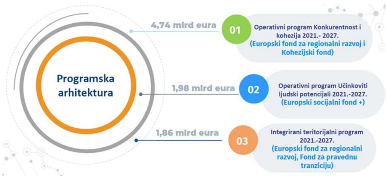
Slika 10. Programi kohezijske politike