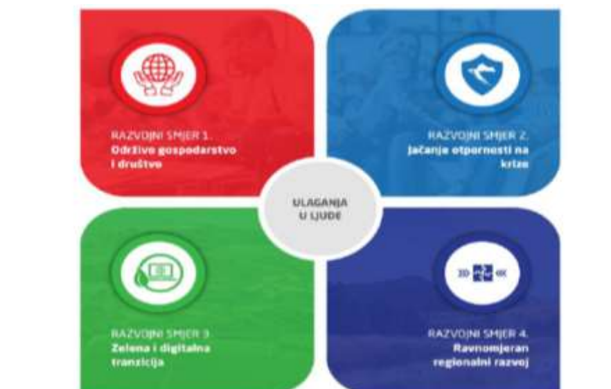
Slika 9. Razvojni smjerovi Nacionalne razvojne strategije RH do 2030. godine