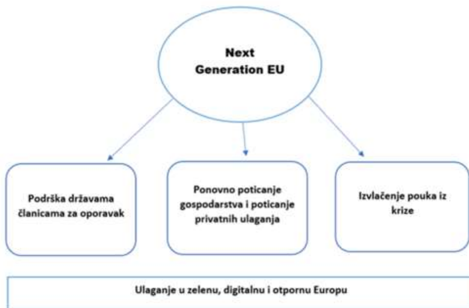
Slika 4. Implementacija programa Next Generation EU

Next Generation EU (NGEU) je izvanredni program Europske unije osmišljen kao odgovor na ekonomske i društvene izazove uzrokovane pandemijom COVID-19. Program je uspostavljen unutar Višegodišnjeg financijskog okvira (VFO) za razdoblje 2021.-2027. s ciljem pružiti snažnu financijsku potporu državama članicama Europske unije kako bi se oporavile od ekonomske i društvene krize uzrokovane pandemijom COVID-19. Sredstva iz NGEU okvira usmjerena su prema prioritetnim područjima poput zdravstva, digitalizacije, zelene tranzicije, infrastrukture te podrške socijalnoj inkluziji. Dodjela sredstava uvjetovana je provedbom reformi i ulaganjima u prioritete EU-a, a države članice moraju predstaviti Nacionalne planove oporavka i otpornosti usklađene s ciljevima i prioritetima EU-a. Program podliježe demokratskom nadzoru kako bi se osigurala transparentnost i učinkovito korištenje sredstava, pri čemu Europski parlament igra važnu ulogu u odobravanju i nadgledanju provedbe programa.