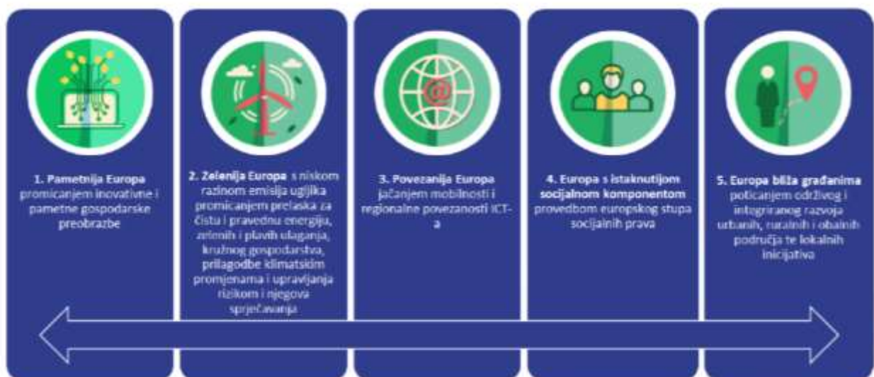
Slika 2. Ciljevi kohezijske politike 2021.-2027.

Izvor: Adria bonus, URL: https://adria-bonus.com/eu-fondovi-2021-2027/