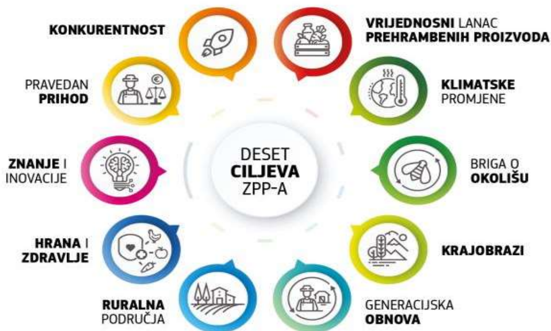
Slika 3. Ključni ciljevi politike ZPP-a