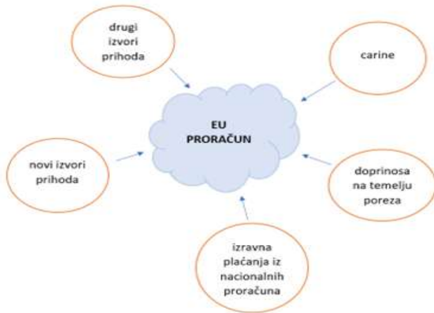
Slika 6. Proračun Europske unije