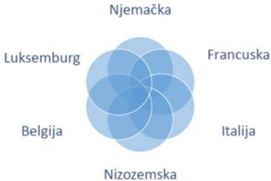
Slika 1. Razvoj Europske unije