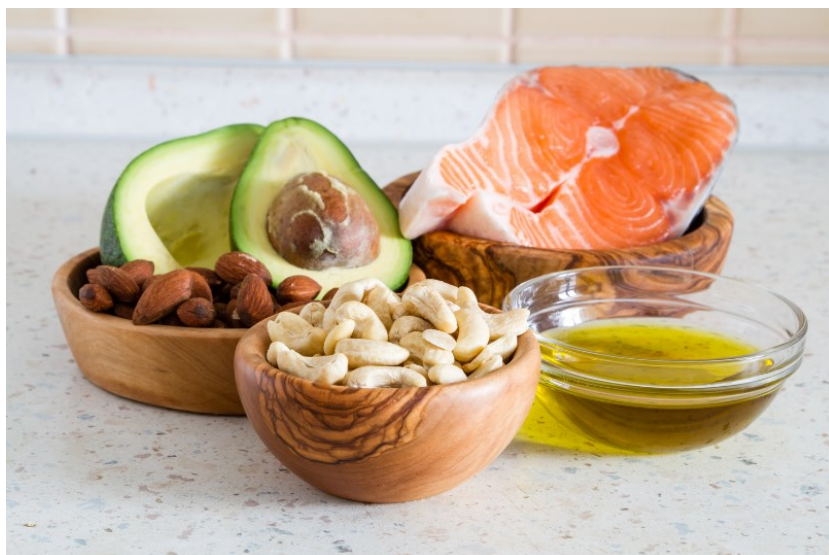
Slika 3. Izvori masti u hrani