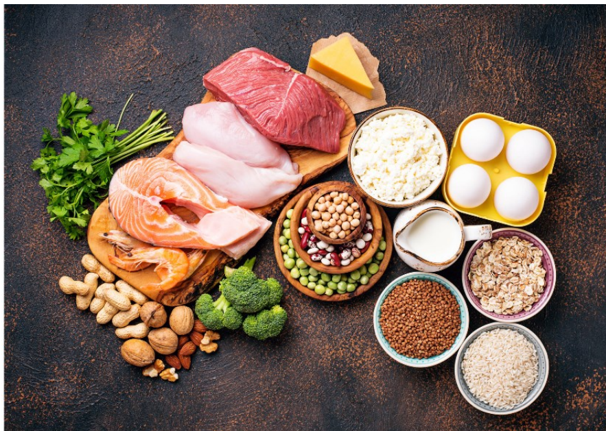
Slika 1. Izvori bjelančevina u hrani

Kompletne bjelančevine sadrže sve esencijalne aminokiseline i uglavnom su životinjskog podrijetla, a najvažniji njihovi izvori su mlijeko, sir, jaja, meso (slika 1) (Mandić, 2004). Nekompletne bjelančevine su pretežno biljnog podrijetla. Nedostaje im jedna ili više esencijalnih aminokiselina i uglavnom se nalaze u namirnicama biljnog podrijetla poput mahunarki i žitarica (Alibabić i Mujić, 2016).