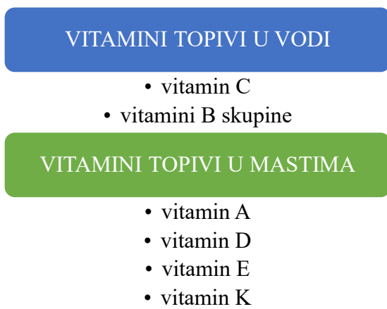
Slika 4. Podjela vitamina prema topivosti (Alibabić i Mujić, 2016)

Vitamini imaju važnu ulogu u različitim biološkim procesima, uključujući metabolizam, imunološku funkciju i sintezu stanica. Obično se unose putem hrane jer tijelo većinu njih ne može sintetizirati. Voće i povrće glavni su izvor mnogih vitamina. U principu se razlikuju po tome jesu li topljivi u mastima ili u vodi (Alibabić, i Mujić, 2016).