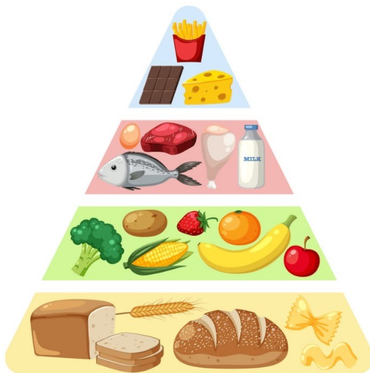
Slika 5. Piramida prehrane djece (Canva, URL)

Posljednju skupinu podrazumijevaju slatkiši. Oni uključuju bombone, kolače, grickalice, sokove s dodanim šećerom. To su rafinirani ugljikohidrati koji brzo stvaraju energiju nakon konzumacije, a koja potom brzo nestane. Slatkiše bi trebalo izbjegavati i konzumirati ih jako rijetko, jer su najštetniji za zdravlje djeteta, pogotovo u tom period kad djeci ispadaju mliječni i rastu im trajni zubi.