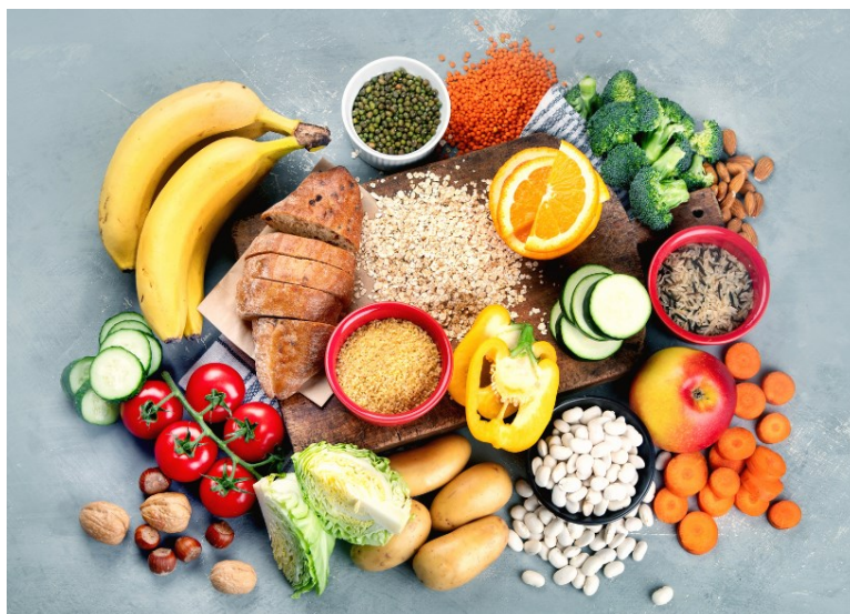
Slika 2. Izvori ugljikohidrata u hrani