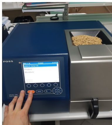
Slika 2. Infratec

Određivanje vlage i proteina u ječmu provodi se na prijemnoj rampi, odmah nakon uzorkovanja ječma iz spremnika vozila. Postupak se provodi pomoću uređaja NIR-spectrofotometar INFRATEC, FOSS TECATOR, po normi NGA-BMS-101.U spremnik uređaja se stavlja uzorak ječma, zatim se odabere program ječmam eng. Barley i pročitaju rezultati na ekranu (interni akti otkupljivača).