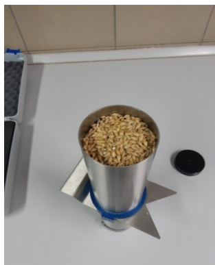
Slika 3. Krondometar