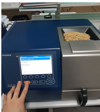
Slika 2. Infratec

Određivanje vlage i proteina u ječmu provodi se na prijemnoj rampi, odmah nakon uzorkovanja ječma iz spremnika vozila. Postupak se provodi pomoću uređaja NIR-spectrofotometar INFRATEC, FOSS TECATOR, po normi NGA-BMS-101.U spremnik uređaja se stavlja uzorak ječma, zatim se odabere program ječam eng. Barley i pročitaju rezultati na ekranu (interni akti otkupljivača).