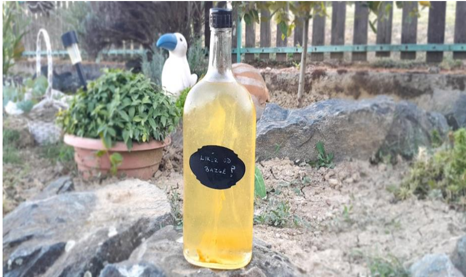
Slika 7. Liker od bazge