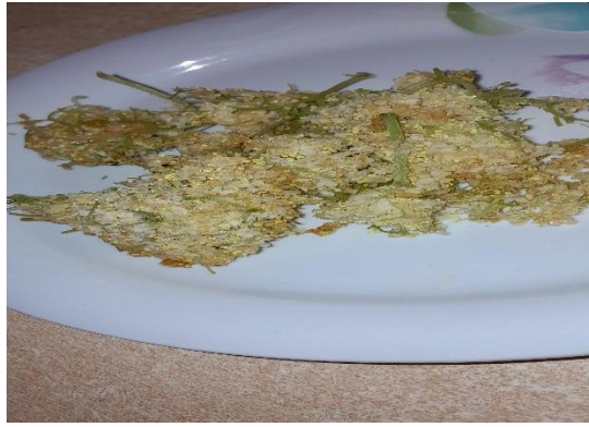
Slika 5. Cvjetovi bazge