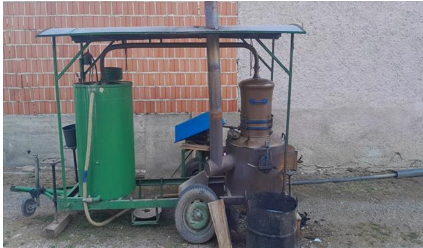
Slika 2. Destilacijski kotao

U Hrvatskoj je šljiva voće koje se najčešće prerađuje u rakiju, a šljivovica je poznata i izvan granica zemlje. Najzastupljenija sorta šljive za proizvodnju rakije je Bistrica (Slika 3), čiji su plodovi sitni i neujednačeni, što ih čini izuzetno pogodnima za ovu namjenu. Bistrica daje plodove s optimalnim omjerom šećera i kiselina, omogućujući proizvodnju šljivovice visoke kvalitete, ugodnog mirisa i izražene arome. U punoj zrelosti, plodovi Bistrice obično sadrže 10-12% ukupnog šećera, ali taj sadržaj može doseći i do 20%, dok se ukupna kiselost kreće između 0,5% i 0,6% (Banić,1997).