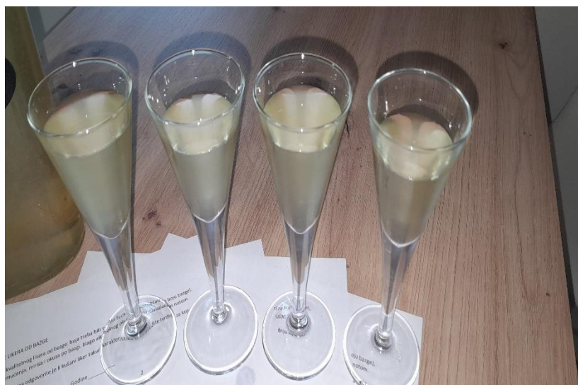
Slika 9. Liker od bazge u degustacijskim čašama