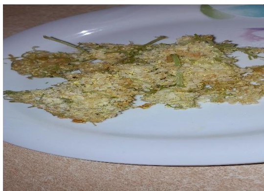
Slika 5. Cvjetovi bazge