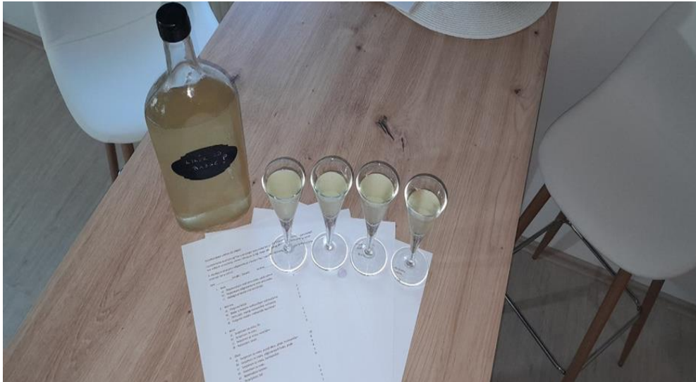
Slika 8. Senzorsko ocjenjivanje likera od bazge