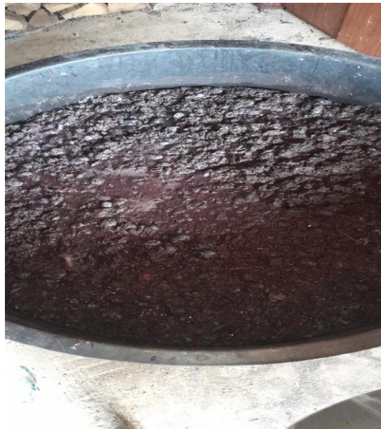
Slika 1. Fermentacija šljive

Spontana fermentacija može rezultirati proizvodima neujednačene kvalitete i traje dulje u usporedbi s kontroliranom fermentacijom s čistom mikrobnom kulturom, koja omogućuje dobivanje proizvoda konzistentne kvalitete (Mrvičić, 2015.). Samo vrijeme alkoholne fermentacije ovisi o temperaturi na kojoj se fermentacija provodi, količini prisutnih kvasaca, i količini šećera prisutnog u plodovima voća. Vrijeme završetka fermentacije karakterizirano je koncentracijom šećera u voćnoj komini manjoj od 0,3 %. Kako ne bi došlo do razvitka nepoželjnih nusprodukata metabolizma kvasaca, poželjno je provoditi fermentaciju voćne komine duži vremenski period pri niskim temperaturama (10-15 °C) (Grba i Stehlik-Tomas, 2010.). Tijekom alkoholne fermentacije (Slika 1), osim etanola i ugljikovog dioksida, nastaju i nusproizvodi metabolizma kvasca kao što su glicerol, acetaldehid, diacetil, octena kiselina, esteri i viši alkoholi. Glicerol je slatka viskozna tekućina koja je poželjna u voćnim kominama i vinu, a kvasac troši oko 2,5% ukupnog šećera za njegovo stvaranje. S druge strane, acetaldehid, diacetil i patočna ulja su nepoželjni jer mogu pridonijeti neugodnom mirisu i nepoželjnoj aromi destilata. Ako fermentacija nije pravilno vođena, koncentracija ovih spojeva u voćnoj komini može porasti, što može inhibirati kvasac. Međutim, niske koncentracije acetaldehida su poželjne jer formiranjem acetala doprinose cvjetnim notama pića (Banić,2006.).