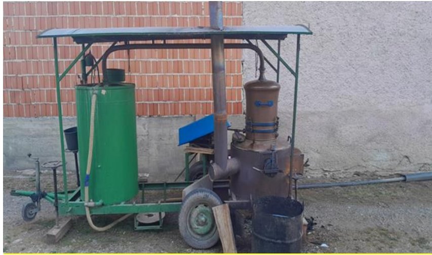
Slika 2. Destilacijski kotao

U Hrvatskoj je šljiva voće koje se najčešće prerađuje u rakiju, a šljivovica je poznata i izvan granica zemlje. Najzastupljenija sorta šljive za proizvodnju rakije je Bistrica (Slika 3), čiji su plodovi sitni i neujednačeni, što ih čini izuzetno pogodnima za ovu namjenu. Bistrica daje plodove s optimalnim omjerom šećera i kiselina, omogućujući proizvodnju šljivovice visoke kvalitete, ugodnog mirisa i izražene arome. U punoj zrelosti, plodovi Bistrice obično sadrže 10-12% ukupnog šećera, ali taj sadržaj može doseći i do 20%, dok se ukupna kiselost kreće između 0,5% i 0,6% (Banić,1997).