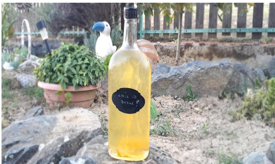
Slika 7. Liker od bazge