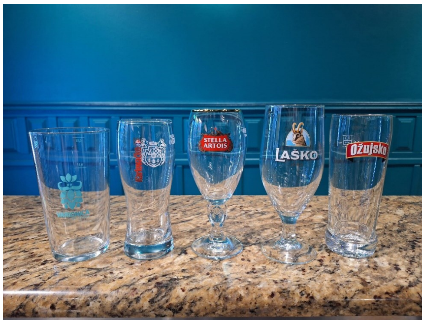
Slika 16. ponuda čaša u četvrtom ugostiteljskom objektu

Konobar pivo poslužuje na način da pivo otvori u šanku, donosi pivo pred gosta te ga ne ulijeva u čašu gosta. Pivo se poslužuje u visokoj čaši, ravnoj čaši, pehar čaši i pinta čaši (slika 16). Piva se nalaze u hladnjacima na temperaturi od 5 °C.