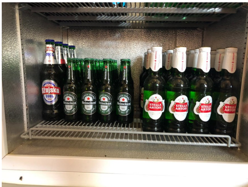
Slika 11. Ponuda piva u trećem ugostiteljskom objektu (drugi dio)

Treći objekt isto kao i prethodna dva objekta nemaju prezentaciju piva. Pivo se poslužuje u visokim čašama i pehar čašama (slika 13), te pri posluživanju konobar ne ulijeva pivo u čašu gosta. Temperatura hladnjaka iznosi 3 °C.