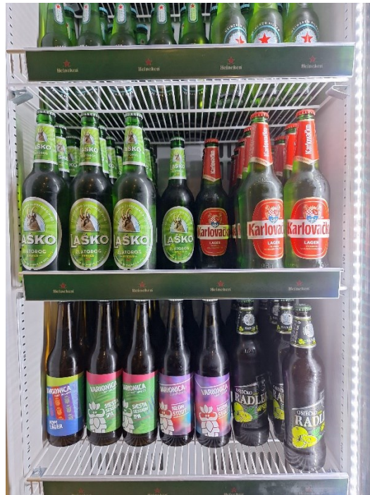
Slika 15. Ponuda piva u četvrtom ugostiteljskom objektu (treći dio)

Konobar pivo poslužuje na način da pivo otvori u šanku, donosi pivo pred gosta te ga ne ulijeva u čašu gosta. Pivo se poslužuje u visokoj čaši, ravnoj čaši, pehar čaši i pinta čaši (slika 16). Piva se nalaze u hladnjacima na temperaturi od 5 °C.