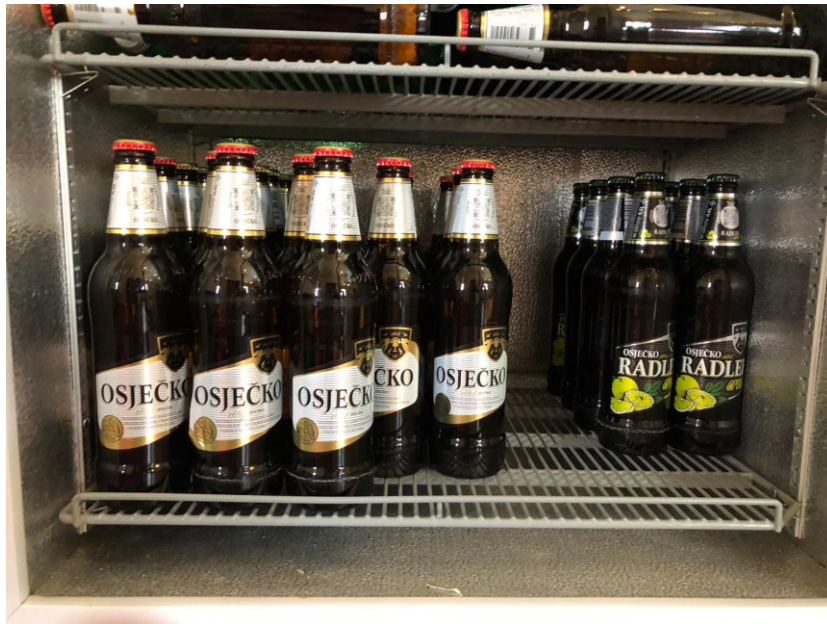
Slika 10. Ponuda piva u trećem ugostiteljskom objektu (prvi dio)