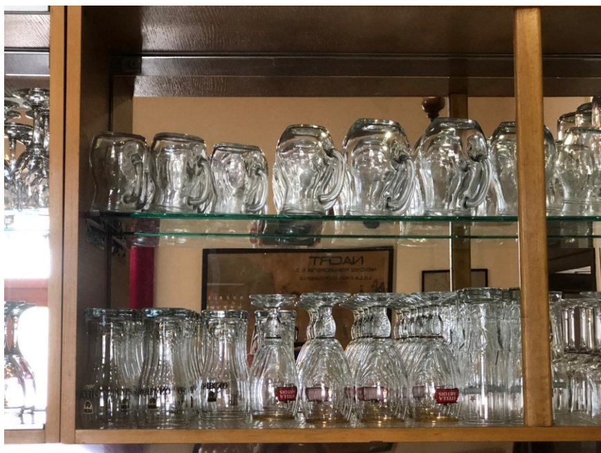
Slika 12. Čaše u trećem ugostiteljskom objektu