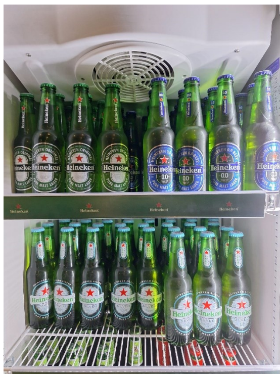
Slika 14. Ponuda piva u četvrtom ugostiteljskom objektu (drugi dio)