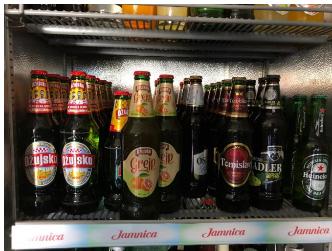
Slika 5. Ponuda piva u prvom ugostiteljskom objektu

U tablici su prikazana dva svijetla lager piva (Osječko i Heineken) s količinom od 5 % i 4,5 % alkoholnog volumena. Ožujsko kao vrhunsko svijetlo pivo sa 5 % alkoholnog volumena, zatim dva miješana piva, crno i svijetlo lager pivo (Osječko radler i Ožujsko grejp) sa 2 % alkoholnog volumena i Tomislav, jako crno lager pivo sa 7,3 % alkoholnog volumena.