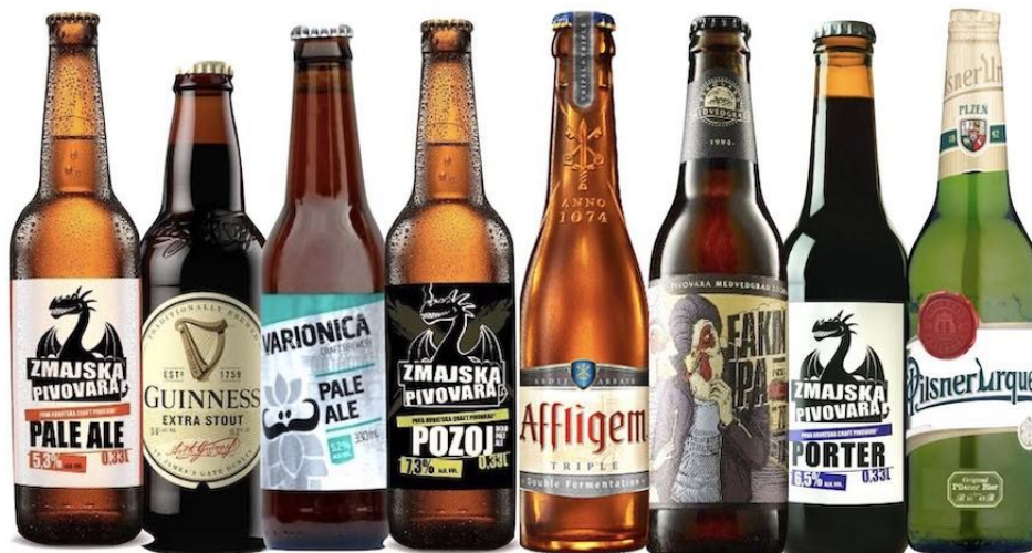
Slika 3. Piva (plavakamenica, url)