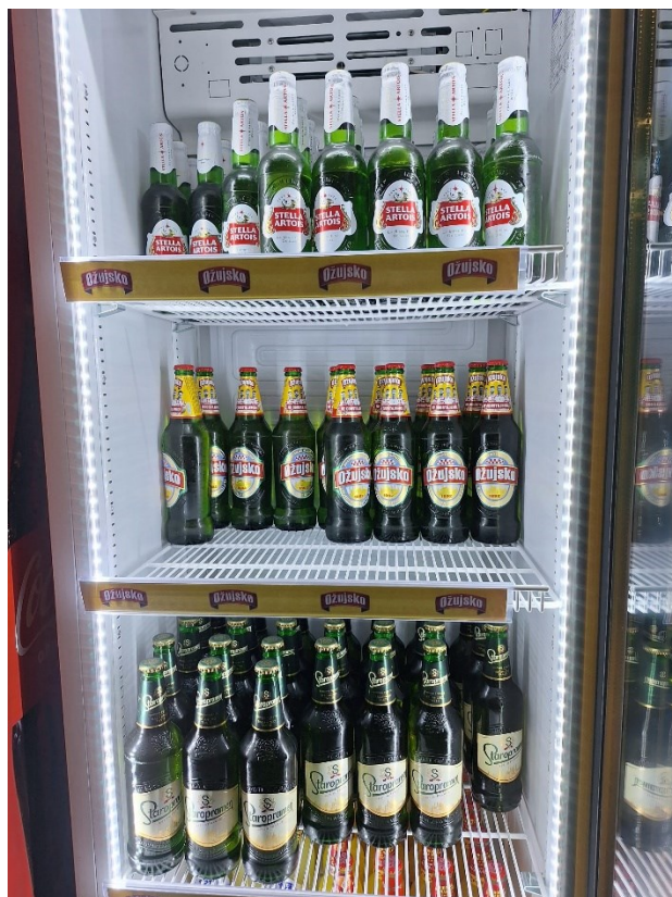
Slika 13. Ponuda piva u četvrtom ugostiteljskom objektu (prvi dio)