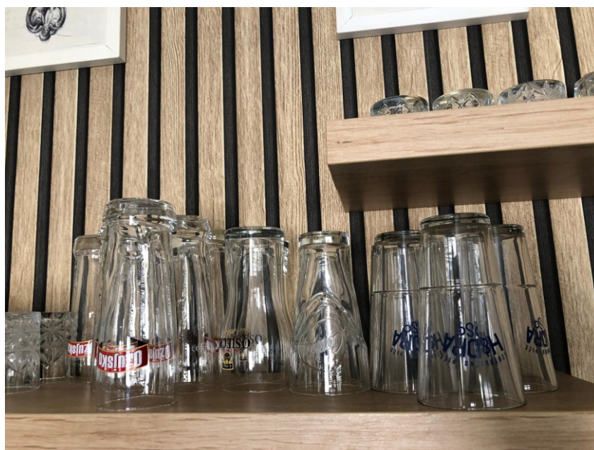
Slika 6. Čaše za pivo u prvom ugostiteljskom objektu

Objekt nema prezentaciju piva kroz ponudu „jelo iz jelovnika plus određeno pivo“ te ne daju preporuke za pivo. Pivo poslužuju u visokim i ravnim čašama. Konobar pivo otvara u šanku, donosi ga pred gosta ali ga ne ulijeva u čašu gosta. Svijetla i tamna piva poslužuju se na istoj temperaturi, temperatura hladnjaka u kojem se pivo nalazi iznosi 2 °C.