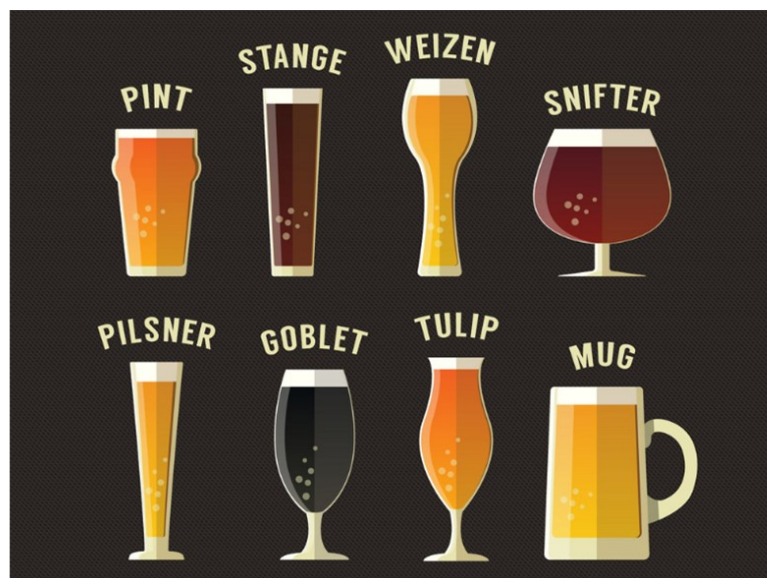
Slika 4. Vrste čaša za pivo (beerstyle, url)

U ravnoj čaši se serviraju piva kod kojih je potrebno istaknuti nijanse hmelja i slada (Gagić, 2016: 233-235).