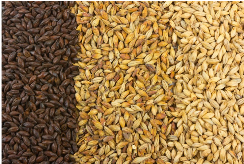
Slika 1. Vrste slada (hocupivo, url)

Crni slad je zapravo čokoladni slad koji je zagrijan gotovo do paljenja. Ima jako gorak okus zbog čega se upotrebljava vrlo umjereno, čak i u crnim pivima (Glover, 1999: 35).