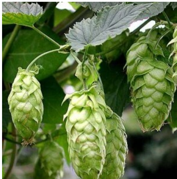
Slika 2. hmelj

Hmelj pivu daje gorke dodatak i aromu. Osim gorčine i arome hmelj ima višestruku namjenu u pivu. Taloži bjelančevine iz sladovine i tako pridonosi bistrenju piva, pospješuje stvaranje pjene, produljuje vijek trajanja piva i daje mu ugodnu gorkost. Za proizvodnju piva koriste se samo ženski cvjetovi jer ženski cvjetovi daju češere koji se tijekom sazrijevanja pune žutom supstancom (luplin). Luplin je kompleksno ulje koje sadrži alfa kiseline koje hmelju daju karakterističnu gorčinu. Danas se u industriji proizvodnje piva uglavnom upotrebljavaju procesirani derivati ili ekstrakt hmelja (Vogel, 2006: 31).