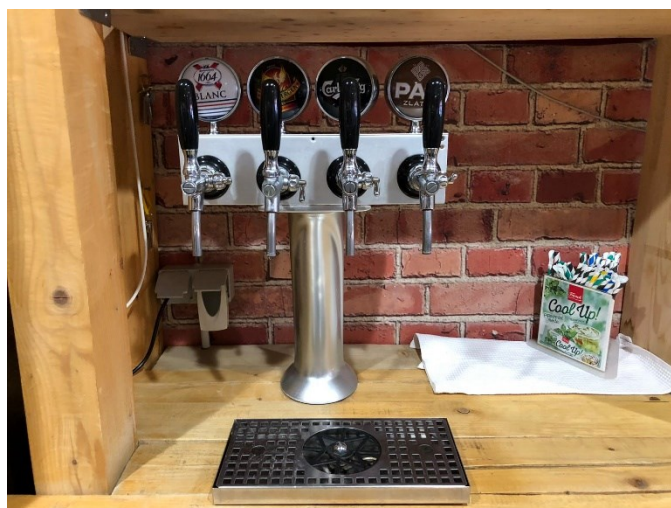
Slika 8. Točionik za pivo

Objekt nema prezentaciju piva. Pivo se poslužuje u ravnim čašama, visokim čašama i tulip čašama (slika 10). Pivo se otvara u šanku, konobar ga odnosi pred gosta ali ga ne ulijeva u čašu gosta. Točeno pivo, toči se u šanku (slika 9) te ga konobar odnosi pred gosta. Pivo iz hladnjaka poslužuje se na temperaturi od 2 °C, točeno pivo na temperaturi od 5 °C.