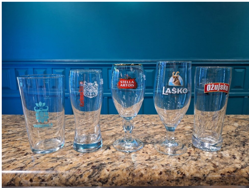
Slika 16. ponuda čaša u četvrtom ugostiteljskom objektu

Konobar pivo poslužuje na način da pivo otvori u šanku, donosi pivo pred gosta te ga ne ulijeva u čašu gosta. Pivo se poslužuje u visokoj čaši, ravnoj čaši, pehar čaši i pinta čaši (slika 16). Piva se nalaze u hladnjacima na temperaturi od 5 °C.