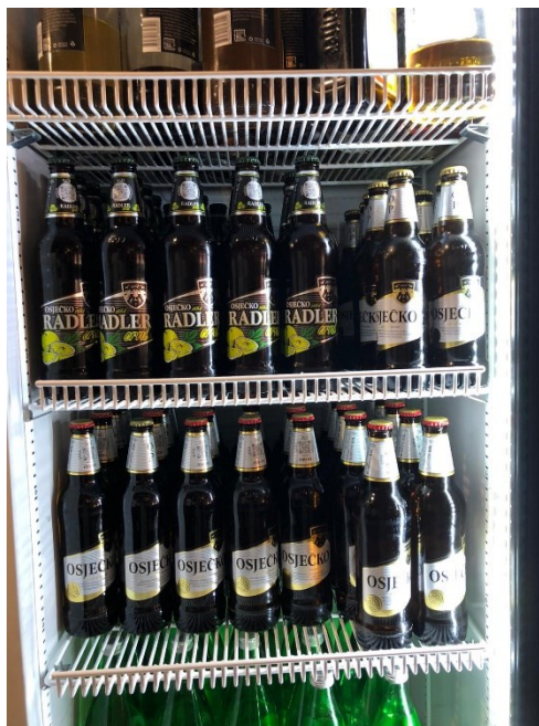
Slika 7. Ponuda piva u drugom ugostiteljskom objektu

U tablici su prikazana piva koja sadrži drugi ugostiteljski objekt. Osječko, svijetlo lager pivo sa 4,5 % alkoholnog volumena. Osječki radler, mješavina crnog piva i bezalkoholnog pića sa 2 % alkoholnog volumena i Pan, svijetlo lager pivo sa 5 % alkoholnog volumena.