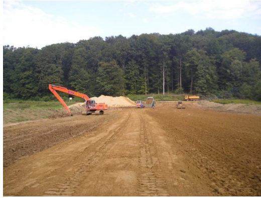
Slika 3. Radovi na izgradnji nasipa