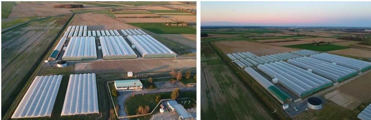
Slika 6. Plastenici tvrtke Brana d.o.o.

Poljoprivredni dio Brane d.o.o. hrabro se je odlučio i na izgradnju 30 plastenika ukupne površine 12.000 m 2 u kojima je planirana sadnja raznog povrća prema potrebama tržišta. U suradnji sa Vidrom, Agencijom za regionalni razvoj Virovitičko – podravske županije, aplicirana su dva projekta u EPFRR programu prema Mjeri 4.1.1. Rekonstruiranje, modernizacija i povećanje konkurentnosti poljoprivrednih gospodarstava. Prvi projekt je podizanje nasada jabuke ukupne površine 10 ha, a drugi izgradnja 20.000 m 2 moderno opremljenih plastenika za proizvodnju povrća. Dobivenim mjerama Brana d.o.o. otvorila je mogućnost zapošljavanja mnogo radne snage te tako doprinijela smanjenju nezaposlenosti u županiji. Također, poticajem za zapošljavanjem na neodređeno, mladih ispod navršениh 30 godina života, država omogućuje poslodavcu oslobađanje od plaćanja doprinosa na plaću u razdoblju od 5 godina što je također utjecalo na smanjenje nezaposlenosti i „vjetar u leđa“ kako Brani, tako i drugim tvrtkama da sve više zapošljavaju mlade ljude.