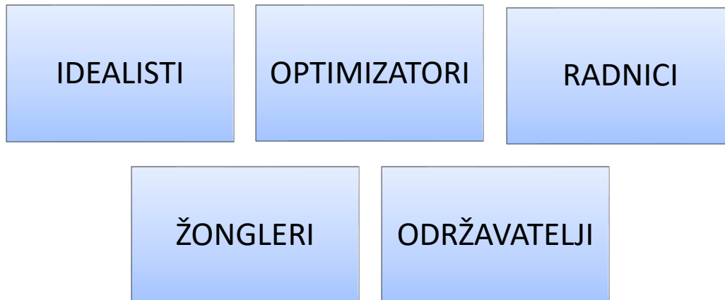
Slika 2. Tipovi poduzetnika