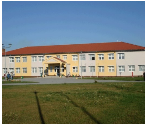
Slika 4. Strukovna škola u Virovitici