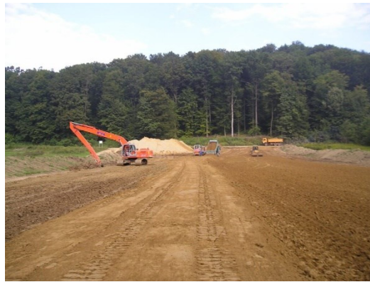
Slika 3. Radovi na izgradnji nasipa