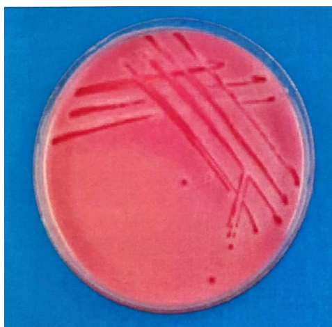
Slika 5. Kolonije vrste Salmonella Enteritidis na Rambach agaru nakon 24 sata inkubacije (Marinculić et al., 2009)