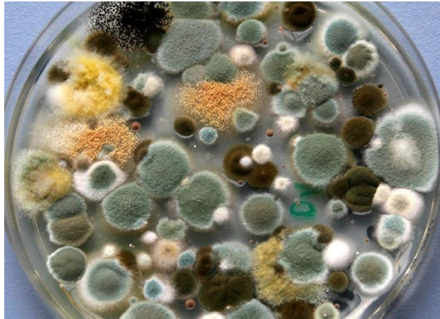
Slika 7. Plijesni