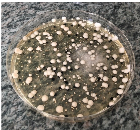
Slika 8. Porasle kolonije kvasaca sa uzorka 8