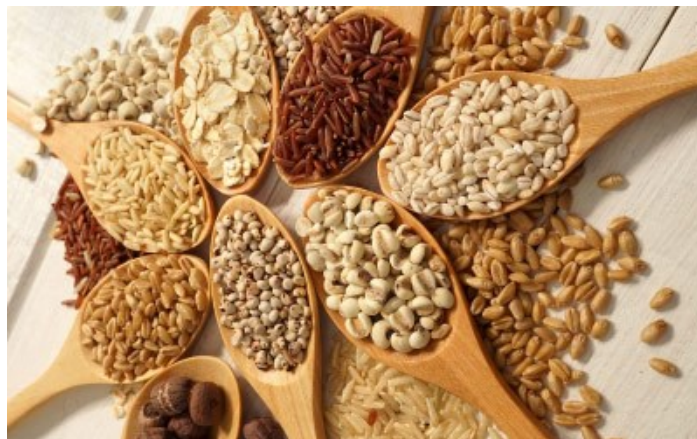
Slika 1. Žitarice

Uobičajena pojava kod pasta od brašna je pojava izrazitog mirisa octene kiseline i estera. Tijesto koje se koristi u raznim vrstama pekarskih proizvoda prolazi kroz fermentacije koje rezultiraju proizvodnjom korisnih i, u nekim slučajevima, neophodnih modifikacija koje donose mikroorganizmi. Te su promjene presudne za stvaranje pojedinih sorti peciva. Kada se paste od brašna i tijesta podvrgnu svojoj tipičnoj kiseloj fermentaciji djelovanjem mliječne kiseline i koliformnih bakterija, moguće je da ovaj proces postane pretjeran ako se dopusti da traje predugo. To može rezultirati viškom kiselosti u tijestu, kruhu te pecivima koja se od njega proizvode. Ako se proteolitičke bakterije previše razmnože tijekom tog razdoblja, to može dovesti do degradacije značajnog dijela bitnog kapaciteta tijesta za zadržavanje plina i rezultirati ljepljivom konzistencijom (Microbiologynote.com, url).