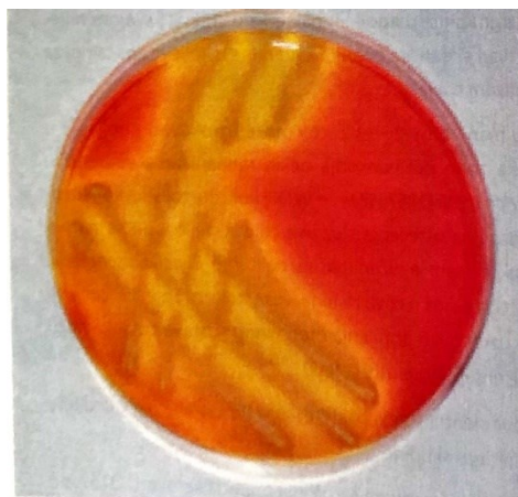
Slika 2. Kolonije vrste Escherichia coli na XLD agaru nakon 24 sata inkubacije (Marinculić et al., 2009)

mlijekom i mliječnim proizvodima, zelenom salatom, dimljenom suhom salamom i mesom divljači (Marinculić et al., 2009).