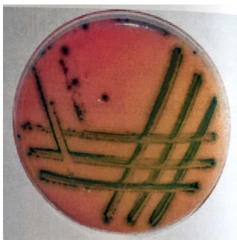
Slika 3. Kolonije vrste Escherichia coli na Rambach agaru nakon 24 sata inkubacije (Marinculić et al., 2009)