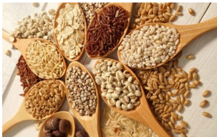
Slika 1. Žitarice

Uobičajena pojava kod pasta od brašna je pojava izrazitog mirisa octene kiseline i estera. Tijesto koje se koristi u raznim vrstama pekarskih proizvoda prolazi kroz fermentacije koje rezultiraju proizvodnjom korisnih i, u nekim slučajevima, neophodnih modifikacija koje donose mikroorganizmi. Te su promjene presudne za stvaranje pojedinih sorti peciva. Kada se paste od brašna i tijesta podvrgnu svojoj tipičnoj kiseljoj fermentaciji djelovanjem mliječne kiseline i koliformnih bakterija, moguće je da ovaj proces postane pretjeran ako se dopusti da traje predugo. To može rezultirati viškom kiselosti u tijestu, kruhu te pecivima koja se od njega proizvode. Ako se proteolitičke bakterije previše razmnože tijekom tog razdoblja, to može dovesti do degradacije značajnog dijela bitnog kapaciteta tijesta za zadržavanje plina i rezultirati ljepljivom konzistencijom (Microbiologynote.com, url).