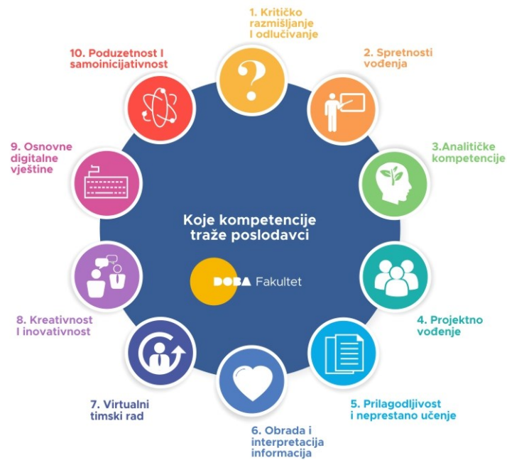
Slika 2. Najtraženije kompetencije zaposlenika;