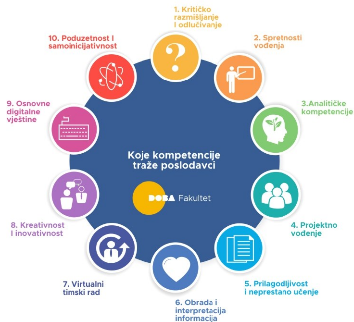
Slika 2. Najtraženije kompetencije zaposlenika;