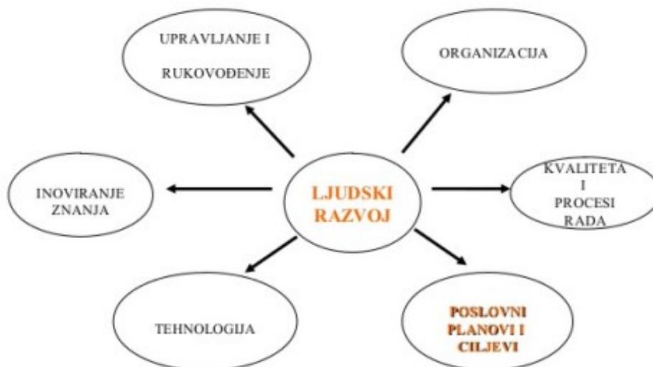
Slika 5. Utjecaj suvremenih ljudskih resursa;