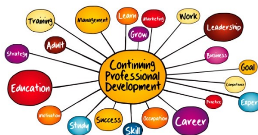
Slika 1. Najbolji čimbenici koji pridonose profesionalnom razvoju;