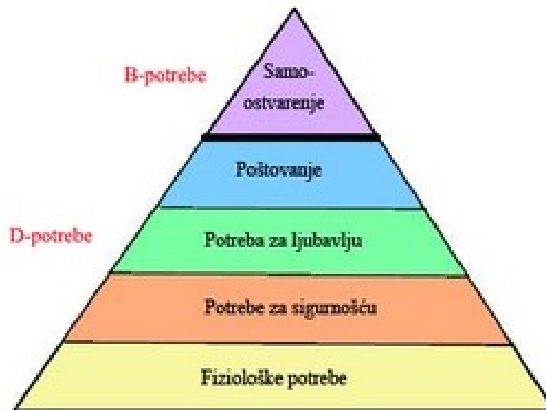
Slika 3. Piramida potrebe prema A. Maslowu;