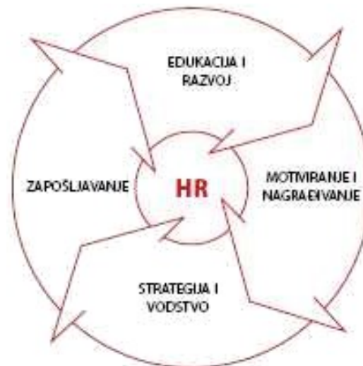
Slika 4. Suvremeno upravljanje ljudskim resursima može se podijeliti u četiri cjeline;