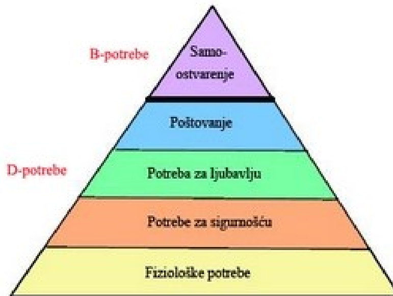
Slika 3. Piramida potrebe prema A. Maslowu;